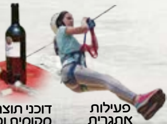
פעילות אתגרית דוכני תוצרת מקומית ומזון