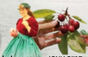
קטיף עצמי מופעים לכל המשפחה