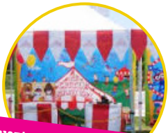
דוכני הפעלות : קליעה למטרה, עמדות משחק, חץ וקשת ועוד ..