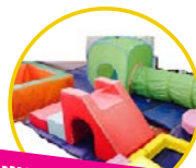
מתחם גימבורי לקטנטנים