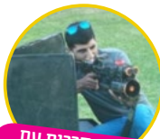
מתחם קרבות עם רובי לייזר