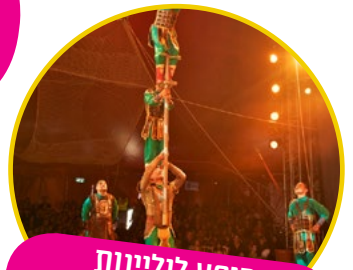
מופע לולינות ואקרובטיקה מרהיב ומיוחד