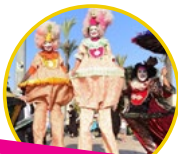
שחקני רחוב ענק